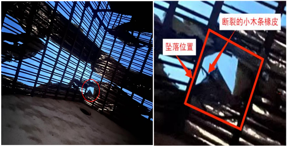
图 4 黄*升坠落位置局部图