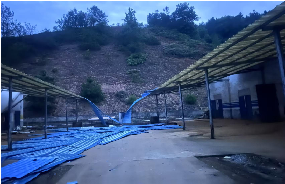
图 2 从屋面拆除下来的瓦片